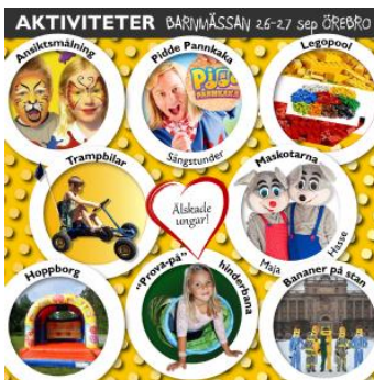
En sammanställning av barnens aktiviteter under mässan: Ansiktsmålning, Pidde Pannkaka show, Legopool, Trampbilar, Stora Holmens kramgoa maskotar, Hoppborg, "Prova-på" Hinderbana och Bananer på Stan.