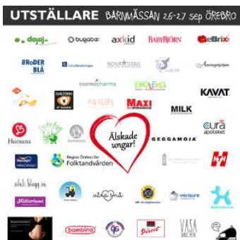
Här är en indikation av alla sponsorer, utställare och märken som slutit upp bakom idén till en ny barnmässa i Örebro.